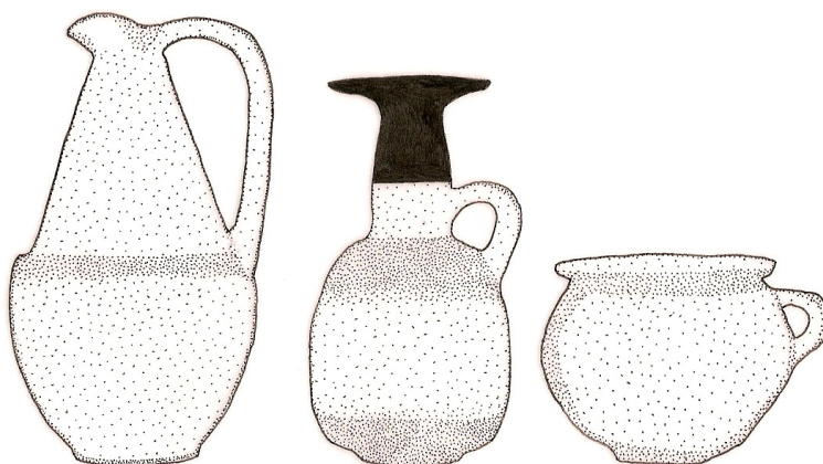
Fig. 3: Oinochoe med kløverbladsformet munding, mushroom flaske og en køkkenvase med hank (tegnet af Signe Krag)