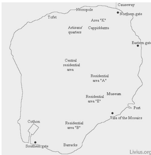
Fig. 1: Mozia

øen, undtagen langs den vestlige kyst 20 . I 397 fvt. blev Mozia besejret af Dionysius fra Syrakus, og herefter blev hovedbefolkningen flyttet til Lilybæum på Siciliens fastland 21 .