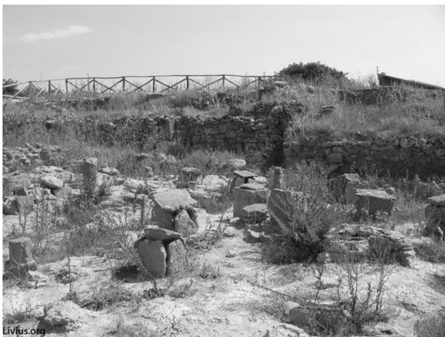
Fig. 2: Nekropolen på Mozia

Jeg vil starte min analyse af gravskikkene ved at se på gravenes udformning og deres placering. Alle grave er placeret på den nordlige kyst af Mozia et stykke væk fra beboelsesområderne, og de bliver i den sydlige del overlappet af en senere bymur 37 . Gravene er ikke placeret efter et bestemt mønster, men er blevet lavet, hvor der har været plads. Dette resulterer i forskellige dybder og afstande, og nogle steder overlapper gravene hinanden 38 . Der har altså ikke været et bestemt område, som har tilhørt en begravelse, men det har været et stort område, hvor alle er blevet begravet op og ned ad hinanden.