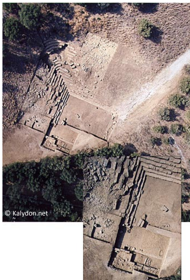
Fig. 3: Luftfoto af teatret.

Vi skulle også overfladetegne vores grøfter og profiltegne to balke. Dagbogskrivningen var en meget vigtig opgave for os som "trenchmasters". Vi skulle skrive i den hver dag, hvor alt fra fund til fortolkninger, og hvad der ellers skete på dagen på udgravningen skulle nedskrives. Vi havde ikke kun ansvaret for vores udgravningsgrøfter og arbejderne, men også dagbogen som skulle hjælpe vores udgravningledere i de næste udgravningsprojekter.